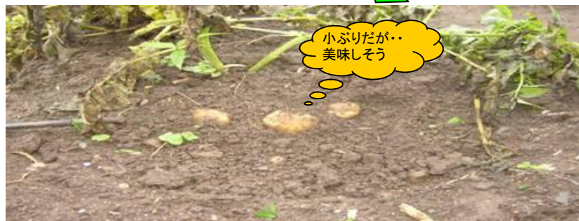
試しに掘って見る！

2009/6/22～ 6/26 ここ1週間、快晴、気温上昇、胡瓜、トマト、茄子、ぐんぐん成長・・・毎日手立てする・・・ (手立てとは: 作物の成長に合わせて延びていく芽を手立ての棒に縛る事)・・・