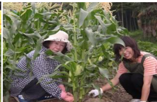
草取り美人2人: ...余談: 私がトウモロコシだったら・・・期待に応え立派に成長しようかな！