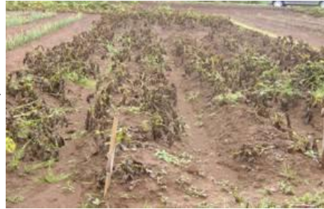
6/21 萎れ・・・枯れ・・・？