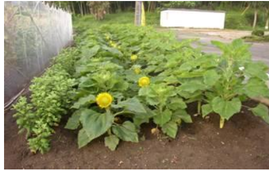
向日葵が咲き始めた・・

2009/7/7(火) 快晴 早朝から畑巡回・・なぜ?・・トウモロコシを食しに害獣がくる・・今日の被害なし・・ 農園周辺で見かけた動物達・・たぬきの夫婦?(不倫、親子・・良くわからない2匹確認) 狐・・以前確認、ハクビシン、野鳥もいる・・雉が夫婦で畑を闊歩している(悪さはしない?)