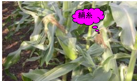
2週間後ぐらいが収穫時期かな?・・

2009/7/7(火) 快晴 早朝から畑巡回・・なぜ?・・トウモロコシを食しに害獣がくる・・今日の被害なし・・ 農園周辺で見かけた動物達・・たぬきの夫婦?(不倫、親子・・良くわからない2匹確認) 狐・・以前確認、ハクビシン、野鳥もいる・・雉が夫婦で畑を闊歩している(悪さはしない?)