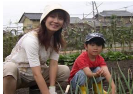
お母さんと一緒にね・・・