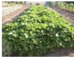
たわわな「さつま葉」