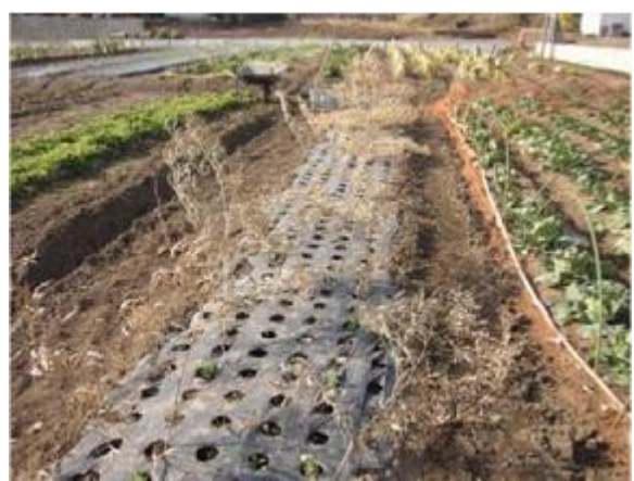
スナックえんどう豆植付(笹の葉で霜よけ対策)