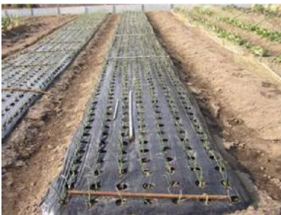
昨年植付けた玉葱・・・大分成長しました。