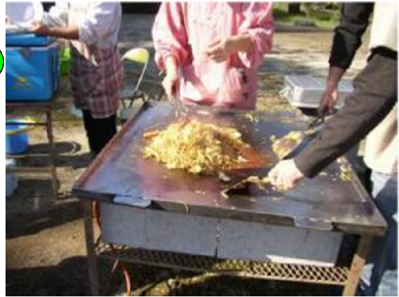
特製B級グルメの「滑川土っ子焼きそば」