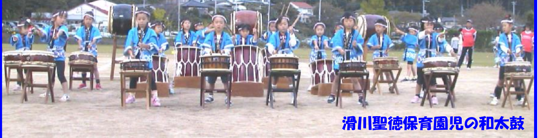
滑川聖徳保育園児の和太鼓