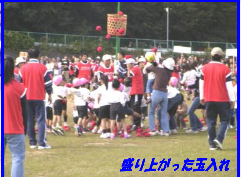
盛り上がった玉入れ