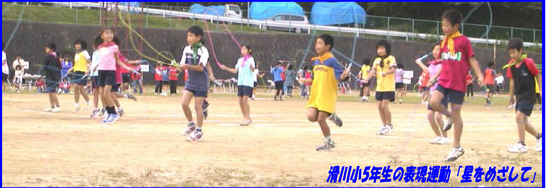
滑川小5年生の表現運動「星をめざして」

10月14日（日）滑川市民広場・交流センターにおいて、第1回なめかわファミリーまつりが、よそおいも新たに開催されました。地域のみなさんの交流と体力の向上を図ることを目的として行われたお祭りを盛り上げるため、滑川ファミリースポーツクラブも多方面においてバックアップさせていただきました。