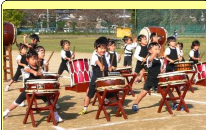
★滑川聖徳保育園児のみなさんによる和太鼓★ 小さな体で一生懸命に太鼓をたたく姿に、みんな感動してしまいました。