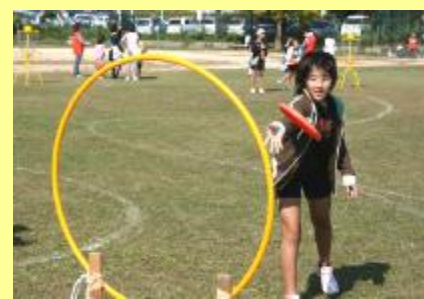
★ディスクターゲットゴルフ★