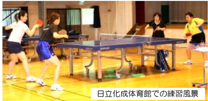
日立化成体育館での練習風景