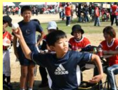
★ストラックアウト★