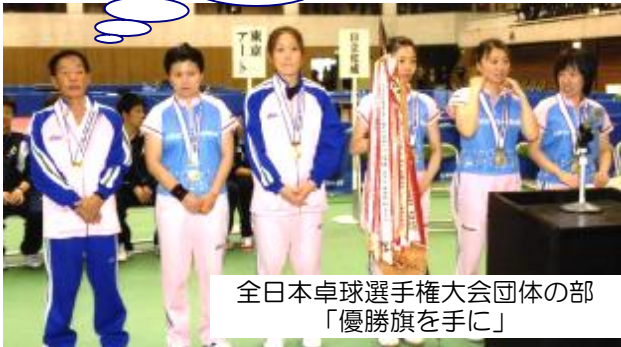
全日本卓球選手権大会団体の部 「優勝旗を手に」