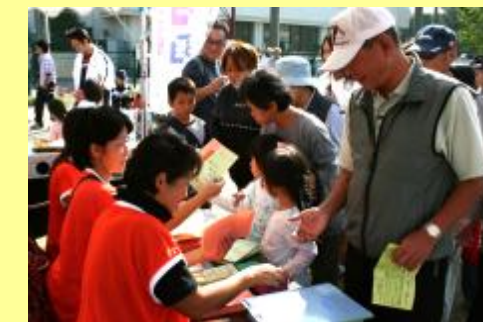
★ハイ！ 抽選券をどうぞ★