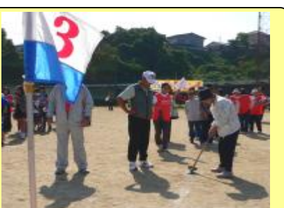
★狙い一発ホールインワン★