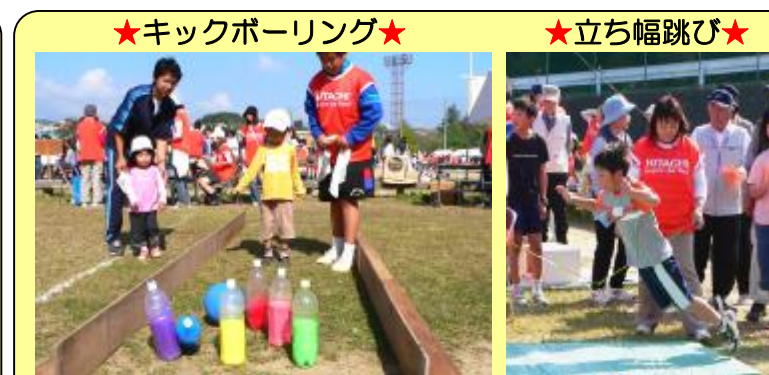
★キックボーリング★