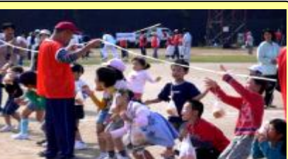
今年も大人気！パン食い競走