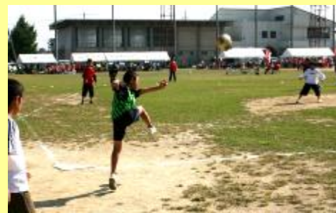
★キックベースボール★