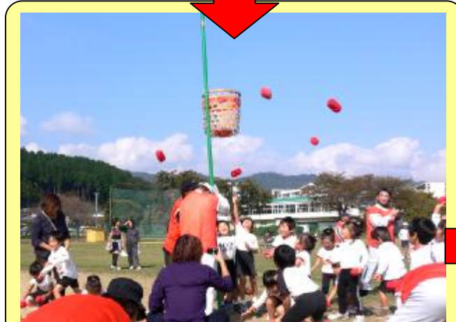
★親子対抗玉入れ★ 大人VS子どもたちの玉入れ対決です。 お父さん、お母さん、おじいちゃん、おばあ ちゃんも一生懸命がんばりました。 結果は・・・子どもたちの大勝利！！ 来年も、エイ・エイ・OH～ですね。