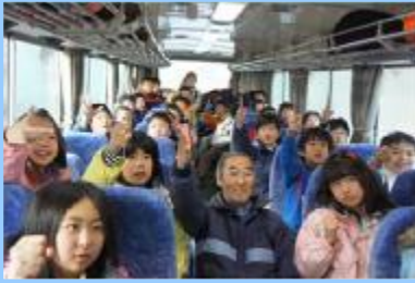
みんな真剣ミーティング