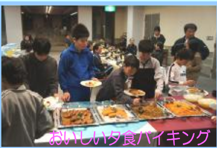
おいしい夕食バイキング