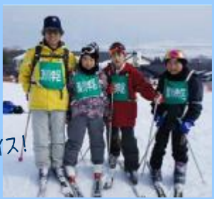
カッコイイ! ナイス!