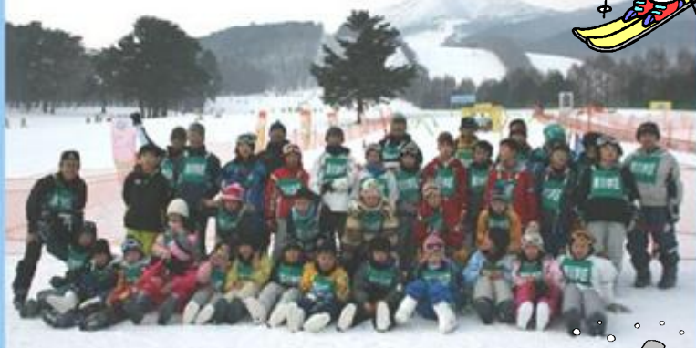
すきすき! スキー全員集合!

福島県の猪苗代スキー場にて行われた「滑川スキー教室」に初参加しました。例年雪不足に悩まされたスキー場も、今年については様子が違うようです。前週は、雪のため磐越道は12時間も渋滞が続いたそうで時間通りの到着が心配されましたが、定刻で猪苗代スキー場に到着しました。午前中は各自のスキー技量に応じた班別のスキー教室、午後と翌日はグループ別の自由滑走が行われ、みるみる実られました。